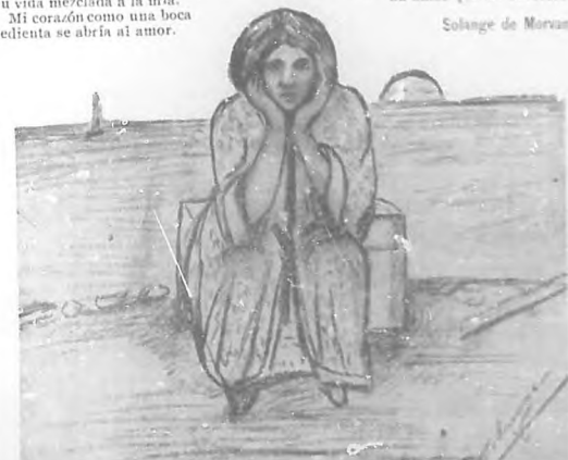
Envuelta en la penumbra del atardecer dejó vagar mi pensamiento experimentando la aguda sensación de una pena inmensa. —Dibujo de Solange de Morvan.

❖ "APOLLO" PIANOS AUTO-TOCADORES CON MOTOR AUTOMÁTICO Y DEDOS NEUNÁTICOS. ❖