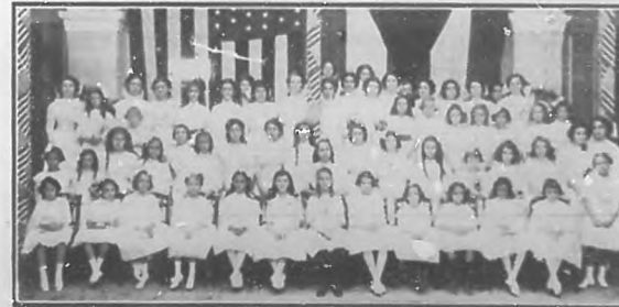
Colegio Dominé, que celebró su repartición de premios días pasados.

Saluda BOHEMIA con toda cordialidad á los simpáticos embajadores de la juventud cubana, y muy especialmente al señor Massip, que lleva