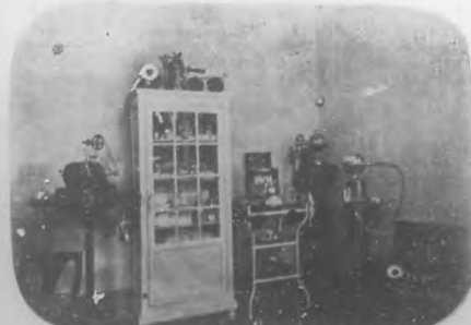
Salón D'Hygiene & de Beauté.—Gabinete de Massage.