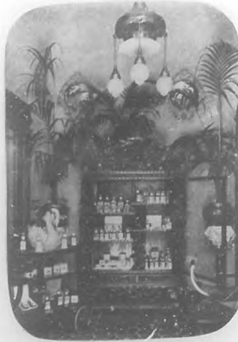
Salón D'Hygiene & de Beauté.—Salón de espera.

Masaje bibratorio manual. Masaje bibratorio eléctrico. Masaje por el vacío. Fototerapia del rostro. Pulverizaciones á vapor. Hidroterapia del semblante. Hay además: Aparatos para adelgazar la nariz.