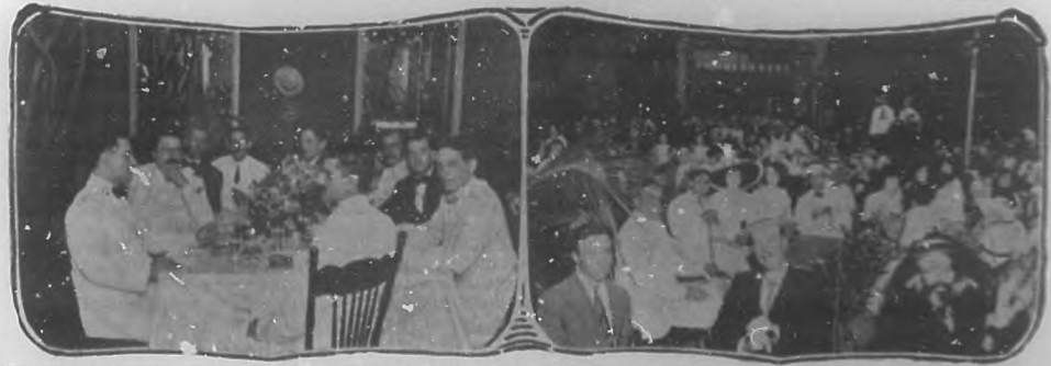
En el Hotel Trotcha.—Aspecto del Jardín.—Noche de concierto.—Un aspecto de la mesa durante la comida ofrecida á un grupo de sus amigos, el pasado jueves, en el mismo Hotel.