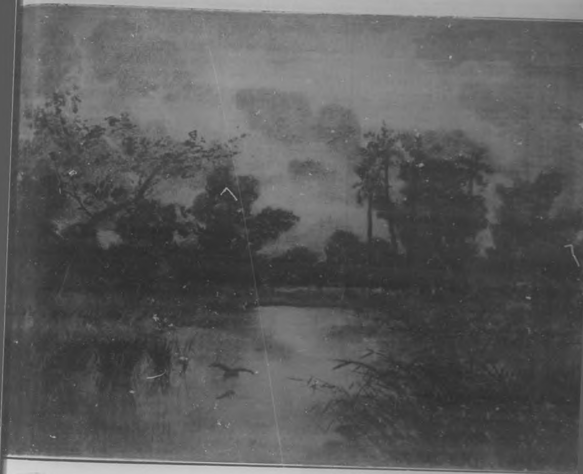
PAISAJE TROPICAL, por Aurelio Melero.