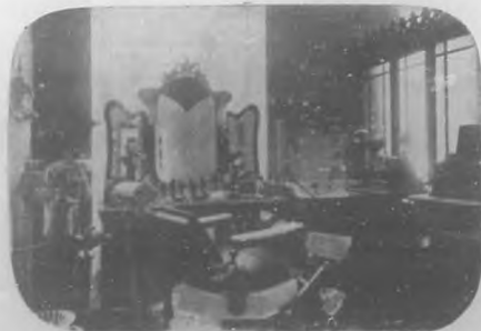
Salón D'Hygiene & de Beauté.—Sala de tratamientos de la belleza.

tos gratis, los que también se le pueden pedir por el teléfono A-4172.