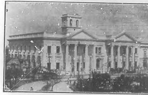
Palacio Provincial de Santa Clara, que será inaugurado dentro de breves días.