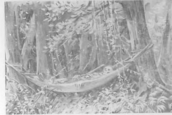
Al regreso de la comisión que atravesara las ciénagas que circundan la 'Isleta de Tortuguero' en busca del patriota Francisco Gonzalo Marín, encontraron en su boscaje los restos del poeta en la actitud que representa nuestro grabado.

Su alma, siempre rehacia a las especulaciones filosóficas que los maestros modernos han condensado en fórmulas eminentemente prácticas, no podía sugerirle la idea de que el pueblo cubano haría la historia para que otros vinieran a escribir la, galardonándose con sus desposos, como dijo Michelet refiriéndose a los memorables desórdenes de