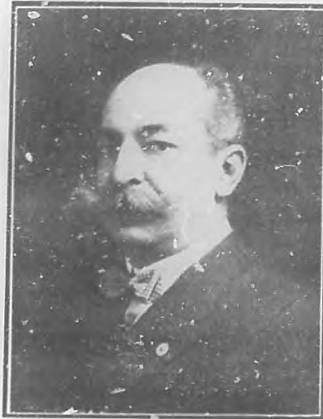
Señor Ramón Aguabella Notable músico cubano.

Además, el regalo del presente mes consiste en un aparador estante estilo modernista, con mármol negro de gran efecto y valor que será sorteado en igual forma que los anteriores.